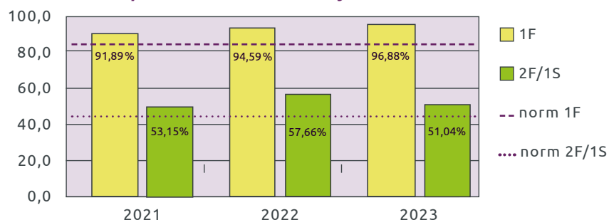
Referentieniveaus laatste 3 jaar

Wilt u meer weten hierover, dan kunt u contact opnemen met de intern begeleider of directeur.